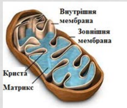
Рис. Будова мітохондрії. Завдання. Користуючись малюнком і текстом, назвіть структурні елементи мітохондрії і основну функцію, яку вона виконує.

Функціональним є поєднання тексту, ілюстрації і навчального завдання.