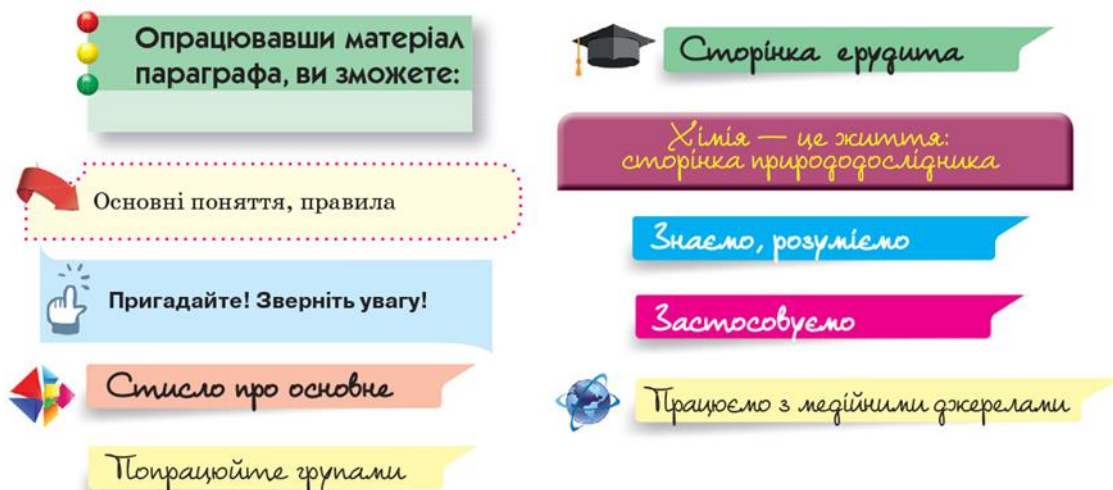
Рис. 1. Рубрики та їхні позначення в авторських підручниках хімії

Анонси «Пригадайте! Зверніть увагу!» [2, 3, 4, 5] стосуються раніше вивченого, короткочасного виконання конкретного завдання в процесі опрацювання нового матеріалу, засобів безпеки під час роботи з речовинами тощо.