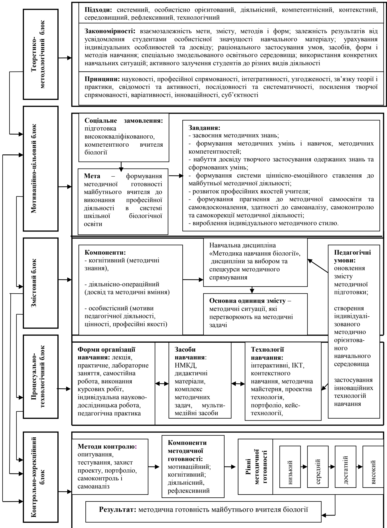
Рис. 1. Концептуальна модель системи методичної підготовки майбутніх учителів біології в педагогічних університетах