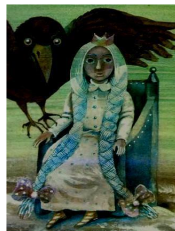
Малюнок 2. Білокоса і Чорний птах – герої твору Валерія Шевчука