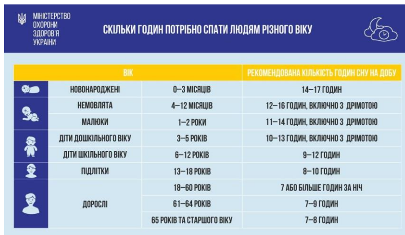
Малюнок 1. Ообов'язкова кількість годин сну на добу, якої повинні дотримуватися люди різного віку