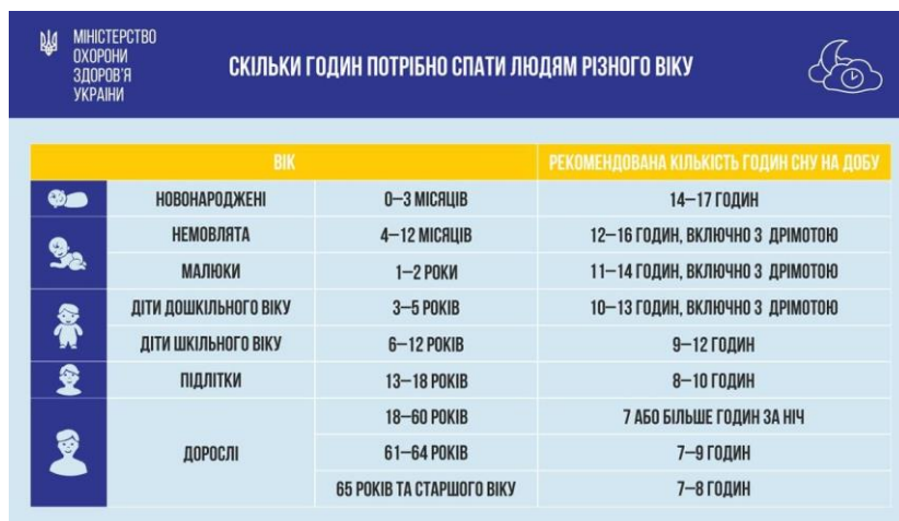
Малюнок 1. Ообов'язкова кількість годин сну на добу, якої повинні дотримуватися люди різного віку

У літературних творах часто наявний мотив сну. Так, увесь сюжет твору «Лелія» Лесі Українки відбувається у сні хлопчика, який разом із царицею ельфів Лелією подорожує. У творі «Чотири сестри» Валерія Шевчука, недосипання однієї із героїнь призвело до швидкого старіння та помилок у прийнятті рішень. Мотив сну є провідним у цій казці-притчі. Крім того автор закликає за жодних обставин не втрачати почуття власної гідності та людяності, а також бути толерантним.