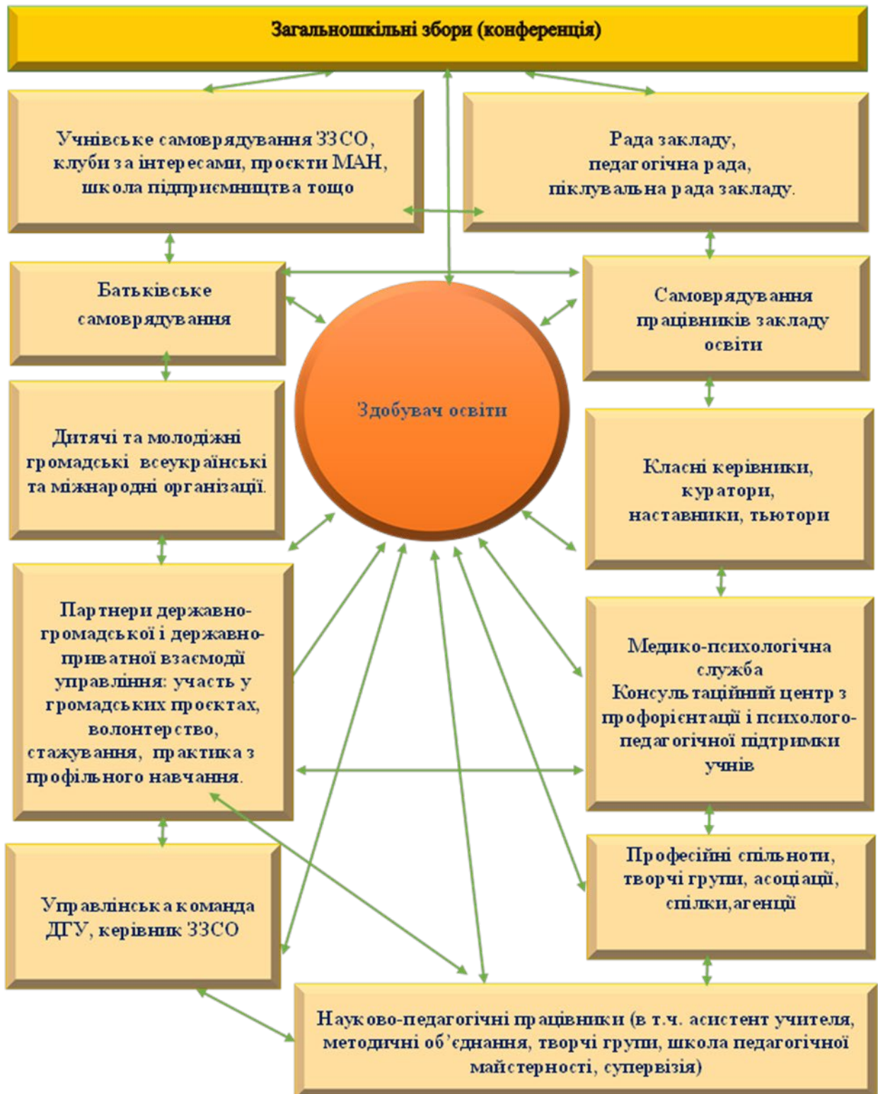
Рис. 1.3 Субмодель «Участь здобувача освіти у державно-суспільному управлінні закладом загальної середньої освіти на засадах суб'єктної партнерської взаємодії»